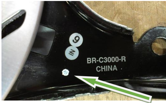
Bild 5, Markierung mit einem weißen Punkt