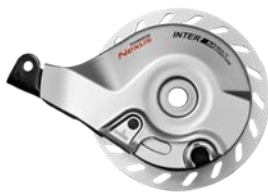
Bild 1, BR-C3000-R, hinten

Betroffen sind nur die Rollenbremsen mit den folgenden Produktionscodes: NF, NG, NH, NI, NJ, NK und NL. Die Rollenbremsen für Vorderräder sind ebenfalls nicht betroffen .