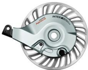
Bild 3, BR-C6000-R, hinten