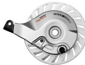
Bild 2, BR-C3010-R, hinten