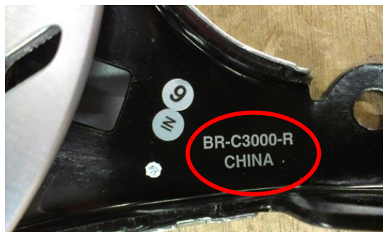
Bild 4, Beispiel für Typenkennzeichnung

Dieser Rückruf gilt nicht für vor dem 1. Juli 2015 verkaufte Fahrräder. Auch betroffene Hinterrad-Rollenbremsen, die mit einem weißen Punkt markiert sind (siehe Abbildung), wurden bereits von SHIMANO überprüft und (erforderlichenfalls) repariert und fallen somit ebenfalls nicht unter diesen Rückruf.